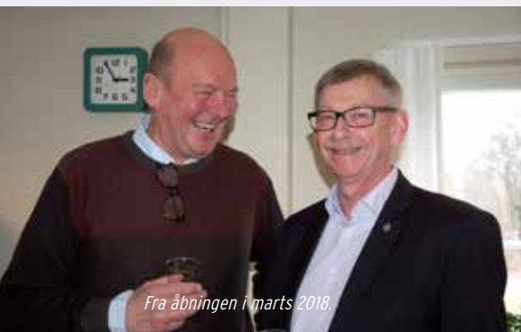
Fra åbningen i marts 2018.

"På et kort møde i går på VeteranCafé Nordsjælland/Halsnæs 1 års dag blev det enstemmigt vedtaget at lukke veterancafeen på grund af manglende tilslutning. Såvel bankkonto som CVR-nummer på Erhvervsstyrelsens hjemmeside er afsluttet og lukket. Danmarks Veteraner, Veteranstøtten samt Veterancentret i Ringsted er informeret. Skulle nogen på et senere tidspunkt ønske, at veterancaféen genopstår, er der betalt medlemsbidrag for 2019 til Frivilligcenter Halsnæs.