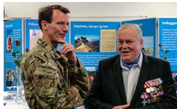
Protetoren og museets formand.

Vi betragter fortsat FN-Museet, som lidt af "vores eget" - I fortæller på smukkeste vis alle veteranernes historie.