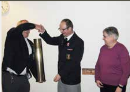
Vinderholdet til kammeratskabsskydning. Østjyderne.