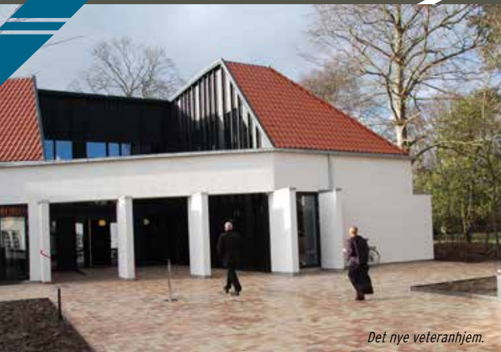
Det nye veteranhjem.