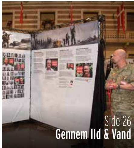
Side 26 Gennem Ild & Vand