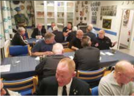
Fra generalforsamlingen. Nordsjælland.