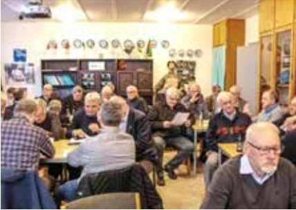
Fra generalforsamlingen. Næstved.