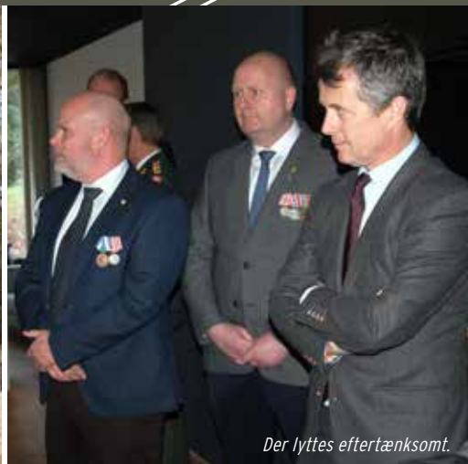
Der lyttes eftertænksomt.