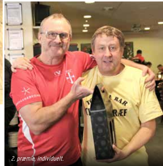
2. præmie, individuelt.