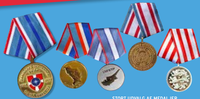
STORT UDVALG AF MEDALJER