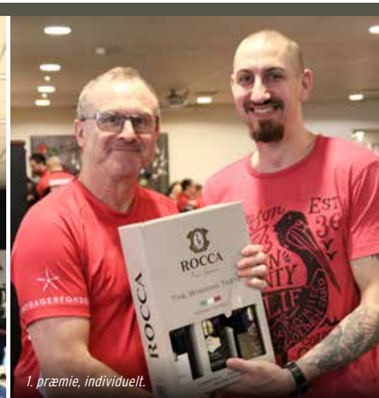
1. præmie, individuelt.

Husk nu, at bowling ikke kun er for de gode, men for alle, der gerne vil have en sjov dag sammen med andre.