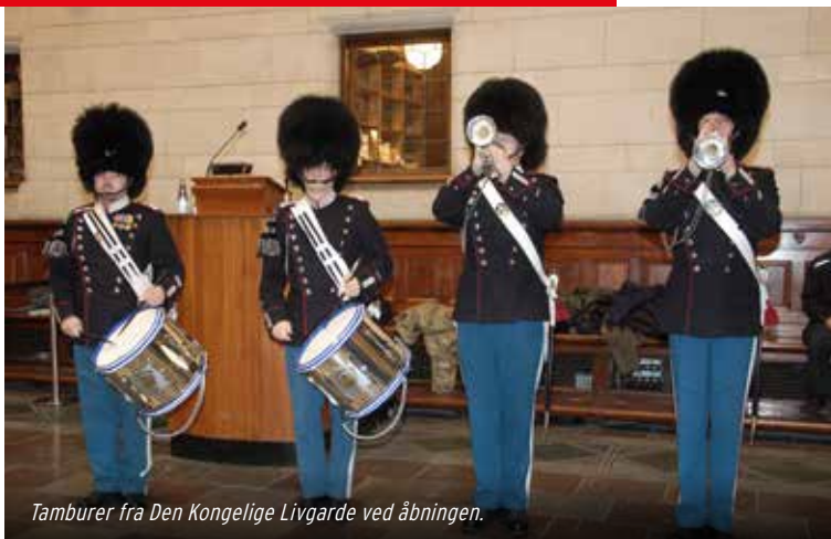
Tamburer fra Den Kongelige Livgarde ved åbningen.