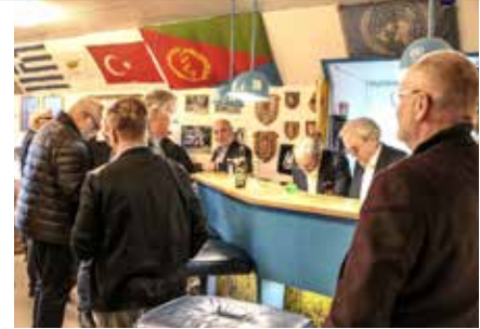
Fra generalforsamlingen. Næstved.

Efter formandens beretning og kassererens regnskab var der valg til bestyrelsen, og resultatet heraf blev: