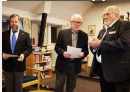
20-års tegn. Nordvestsjælland.