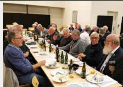
Fra generalforsamlingen. Midtjylland.

Så sæt allerede nu X i kalenderen. I bliver ikke skuffet.