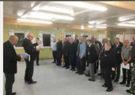
Tegn og medaljer. Nordsjælland.