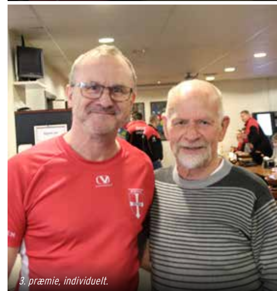
3. præmie, individuelt.