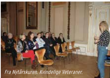
Fra Nytårskuren. Kvindelige Veteraner.

Ved mødet vil vi fortælle nærmere om vores arbejde, og du kan stille eventuelle spørgsmål. Mødet er ganske uforpligtende.