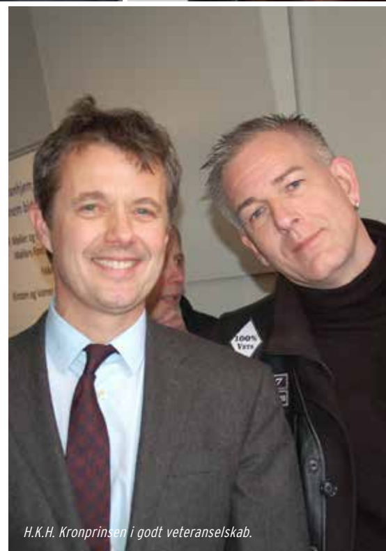
H.K.H. Kronprinsen i godt veteranselskab.