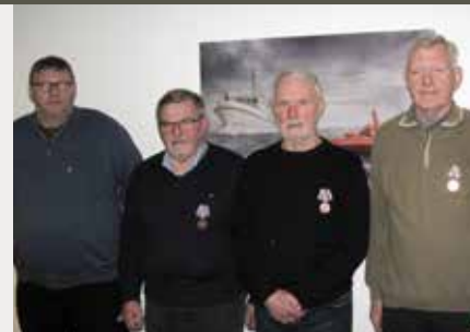
Modtagere af årstegn og medaljer. Østjyderne.

Lørdag den 4. maj: Mindehøjtidelighed ved mindestenen Freden - Glæden - Sorgen ved Viborg Domkirke. De Danske forsvarsbrødre står for dette arrangement, der har følgende program: