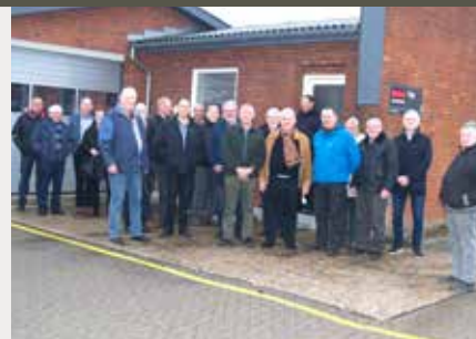
Foran garagen. Kronjylland.

Filmene var meget forskellige, men alle blev underholdt denne aften, som blev fuldendt, da Per midt i det hele dukkede op med pølser og brød, som i løbet af "no time" blev gjort klar på grillen. Tak for en hyggelig aften.