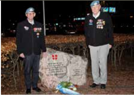
Blomsterlægning ved Mindestenen. Kronjylland.