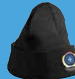
STRIKHUE M/ VETERANMÆRKE