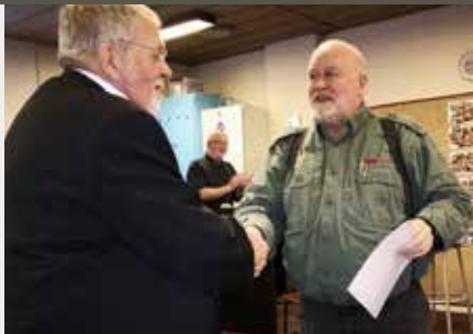
25-års tegn. Nordvestsjælland.