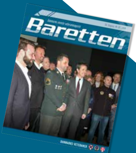
H.K.H. Kronprinsen ved indvielsen af Veteranhjem Odense.