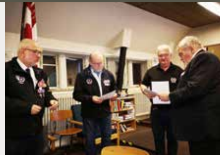
10-års tegn. Nordvestsjælland.