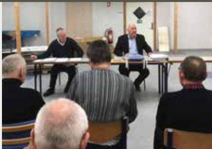
Fra generalforsamlingen. Nordsjælland.