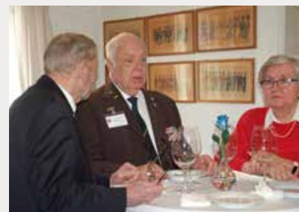
Formanden ved indvielse af Veteranhjem Odense. Fyn.