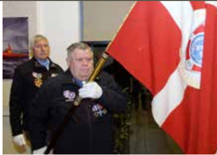
Fanen bæres ind. Kronjylland.