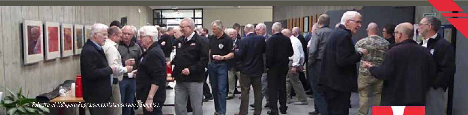
Foto fra et tidligere Repræsentantskabsmøde i Slagelse.