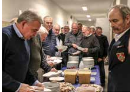
Fra generalforsamlingen. Næstved.