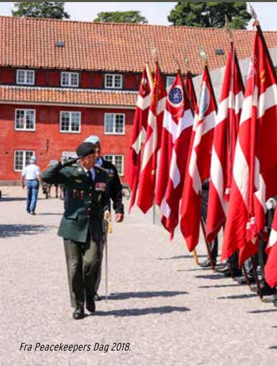
Fra Peacekeepers Dag 2018.