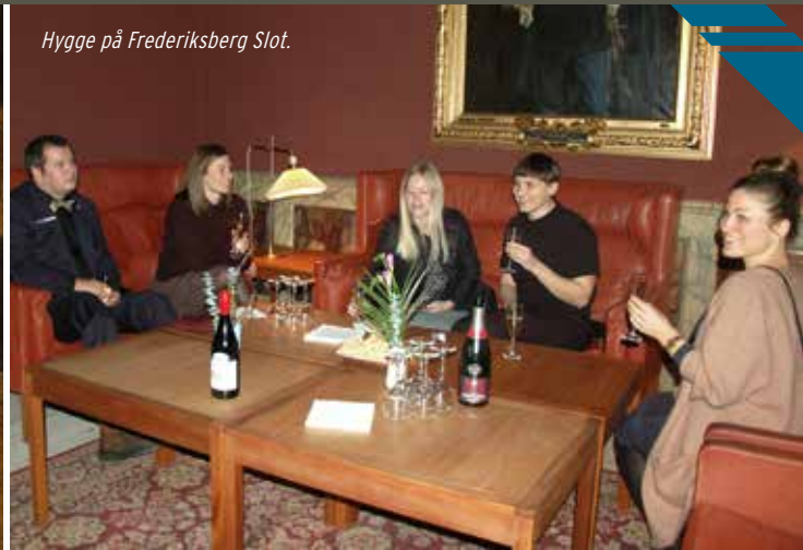
Hygge på Frederiksberg Slot.