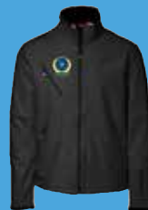
PARADEJAKKE STR. M - 6XL