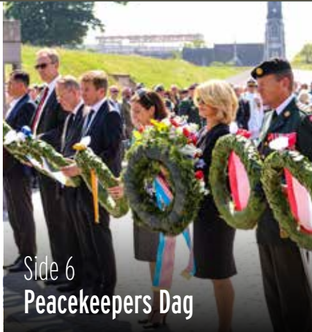
Side 6 Peacekeepers Dag