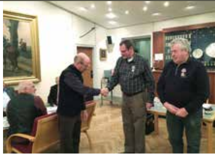
25-års tegn. Nordvest.