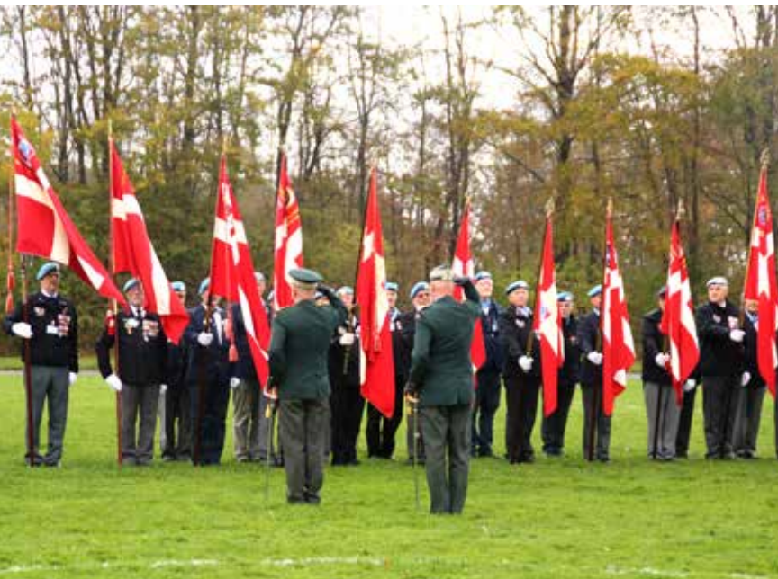
Fra Jubilæumsstævnet 2018.