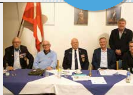
Fra generalforsamlingen. Fyn.

Næste klubaftener er torsdag den 25. april, torsdag den 23. maj og onsdag den 21. august.