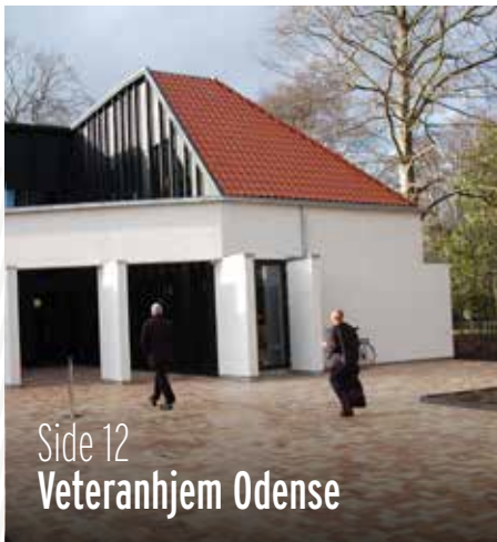
Side 12 Veteranhjem Odense