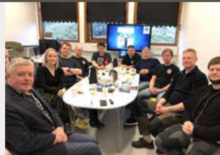
Fra generalforsamlingen. Færøerne.