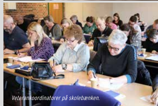
Veterankoordinatorer på skolebænken.