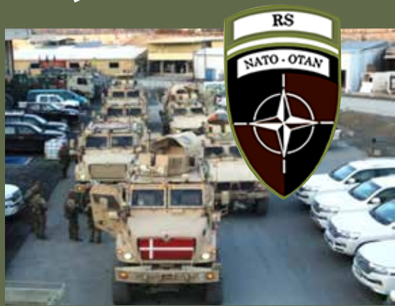
Det danske eskorte- og sikringsbidrag på opgave i Hamid Karzai International Airport.

Det danske hundebidrag støtter med sikring i form af sprængstofsøgning og patruljering.