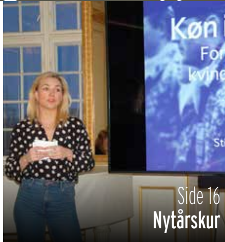
Side 16 Nytårskur