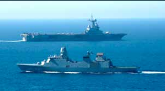
Niels Juel side om side med det franske hangarskib.

Niels Juel og besætning er nu fuldt integreret i hangarskibsgruppen og klar til indsættelse i de opgaver der ligger inden for det mandat, bidraget har med fra Danmark.