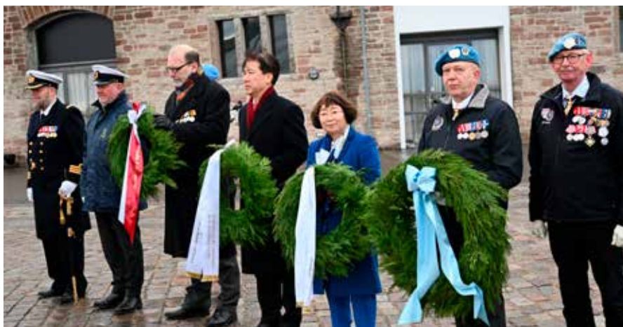
Klar til kranselægning.