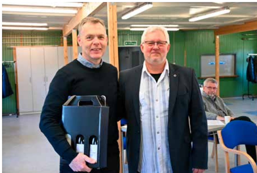
Vingave til revisoren.

Efter generalforsamlingen var der biksemad med spejlæg og tilbehør - og der var god lejlighed til at hygge sig i det gode selskab.