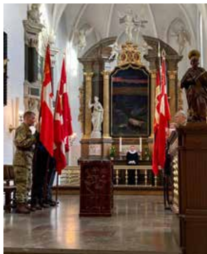
Nytårs gudstjenesten i Sct. Mortens Kirke, Kronjylland.

Endvidere har vi doneret diverse til køkkenet i Veteranhuset, således at vi kan lave og opbevare mad til arrangementerne. Det drejer