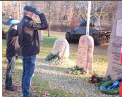
Rindsholm Kro. Viborg & Omegn.