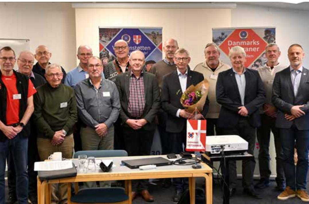
Hovedbestyrelse, udvalgsformænd og ressourcerpersoner.