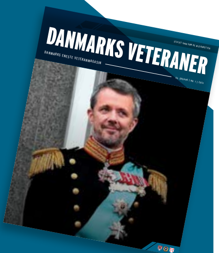
H.M. Kong Frederik X.

"Tak for Deres Majestæts store omsorg og interesse for os veteraner og vores pårørende. Det er normalt Majestæten, der takker os for vores indsats for Danmark. Men nu vil jeg med ære og respekt takke Dem for Deres store indsats for os alle gennem de mange år som regent".