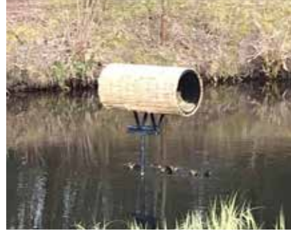
Duck Tupes i Rønnede. Jagtforeningen.