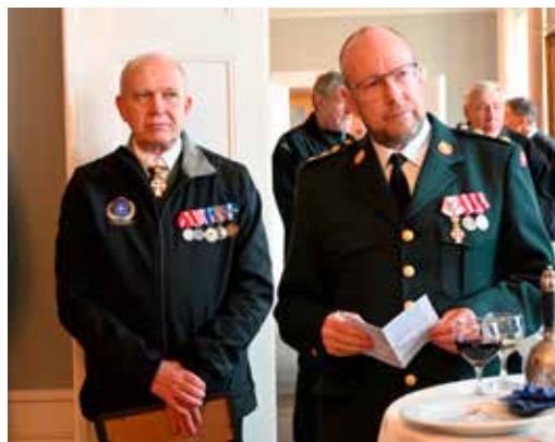
Chefen for Veterancentret (til højre) holder tale.