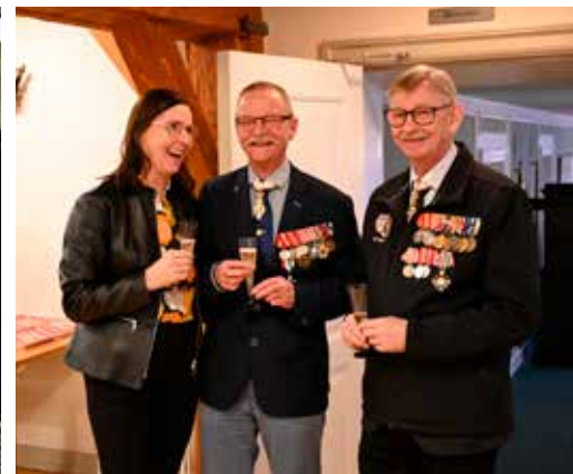
Landsformanden og præsidenten for DSL.

Han orienterede om Folk & Sikkerhed og deres aktiviteter, herunder en stor sikkerhedspolitisk udstilling i Fredericia i april i relation til NATO's 75-års jubilæum.