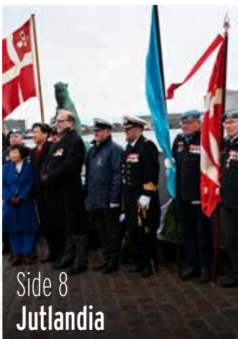
Side 8 Jutlandia