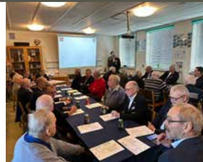
Generalforsamling. Næstved & Omegn.