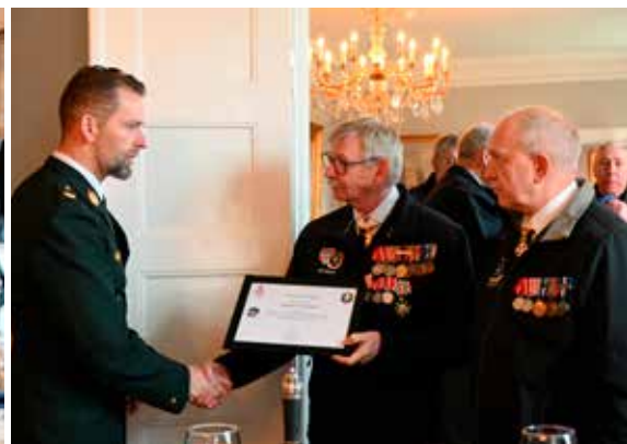
Letter of Appreciation til Danmarks Veteraner.