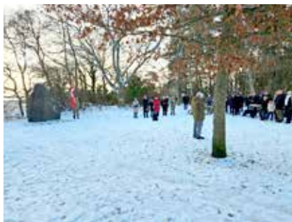
Skæring Hede, 2. december Midtjylland.

Søndag den 7. januar 2024: Det aflyste bankospil blev afviklet i en ny snestorm, som medførte lidt begrænsning i deltagelsen. Der blev serveret æbleskiver og gløgg i pausen, og med et udsolgt lotteri blev mere end 100 flotte sponserede præmier fordelt.