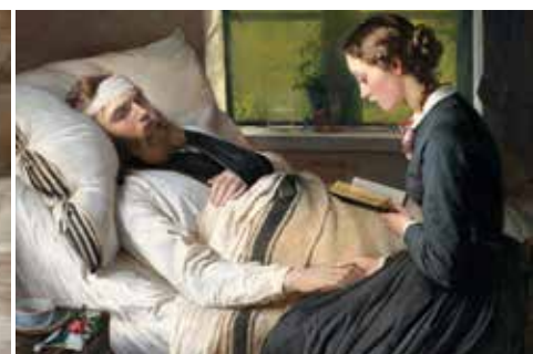
Elisabeth Jerichau Baumann. En såret dansk kriger.