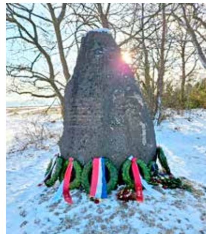
Skæring Hede, 2. december Midtjylland.