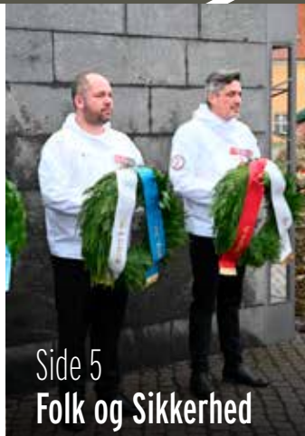
Side 5 Folk og Sikkerhed