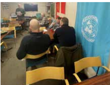
GF afholdt i bunkerens, Kastellet. Jagtforeningen.

er planlagt til efteråret i Rønnede, hvor Jagtforeningen har gjort den lille sø så klar som muligt til dette års Andejagt med Duck tupes i søen mm. De to tupes bliver sat op i slutningen af uge 9. Følg kalenderen og se de nye jagtlods-medlemmers tilbud på vores jagtområde Saxholm i Rønnede.