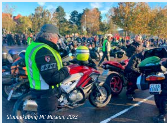
Stubbekøbing MC Museum 2023.

Så hvis du har lyst til at køre ture i et godt,