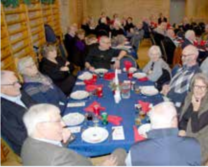
Stiftelsesdag. Næstved & Omegn.