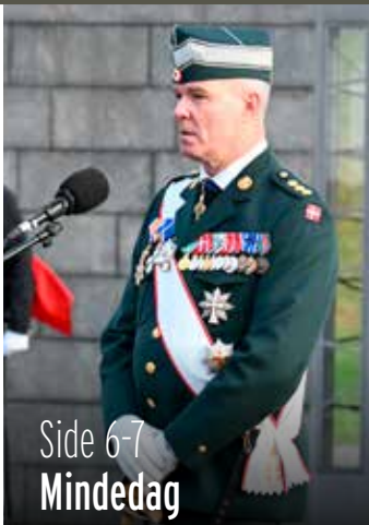
Side 6-7 Mindedag