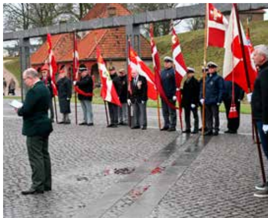
Hærprovsten læser "Bøn til minde om vore faldne".