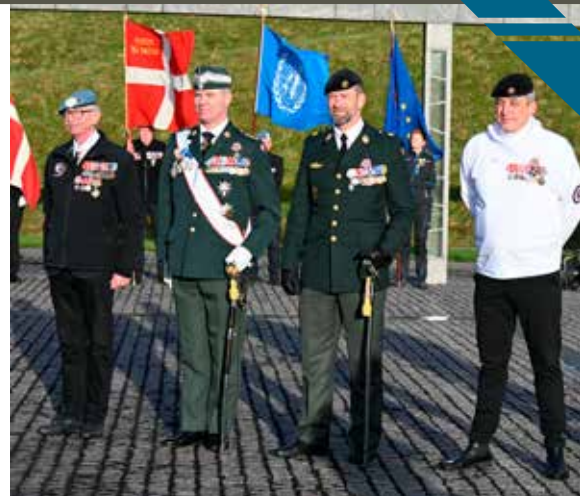
Klar til medaljeoverrækkelse.