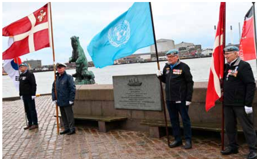
Fanerne ved Mindepladen på Langelinie.