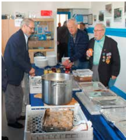
Generalforsamling. Næstved & Omegn.