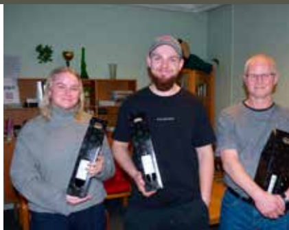
Vindere i skydning, Midtsjælland.

der ikke kunne deltage. Det var en virkelig god og hyggelig aften.