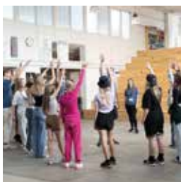
FEDE FÆLLES OPLEVELSER

Sted Raadvad Vandrerhjem, Raadvad 1, 2800 Lyngby