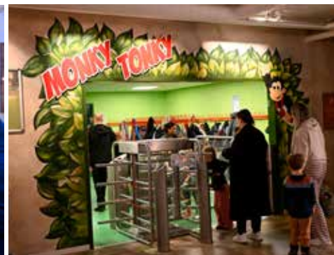
Stemmingsbilleder fra Lalandia.