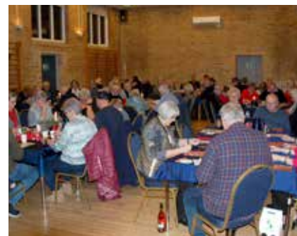
Stiftelsesdag. Næstved & Omegn.