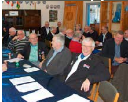
Generalforsamling. Næstved & Omegn.