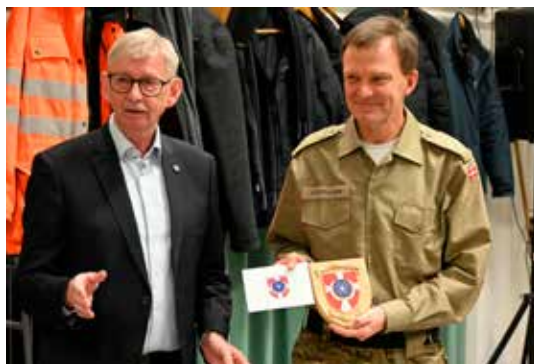
Danmarks Veteraners Skjold til Musikkorpset.