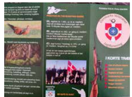
Opdateret brochure. Jagtforeningen.