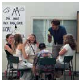
MASSER AF NYE VENNER