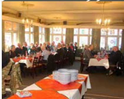
Rindsholm Kro. Viborg & Omegn.