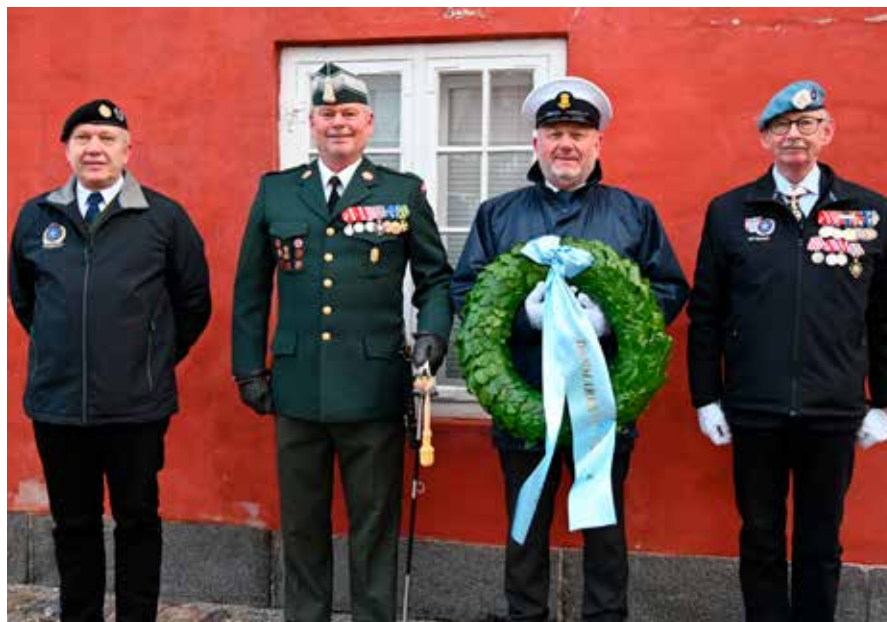
Klar til kranselægning.

Kransen ved Mindestenen blev lagt af landsformand for Danmarks Samvirkende Mari-