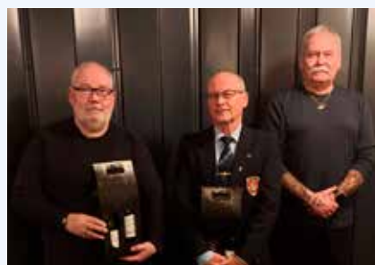
Vingaver uddeles. Nordvest.