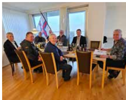
VETS Generalforsamling, Færøerne.