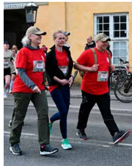
Ikke al gang foregår i løb.