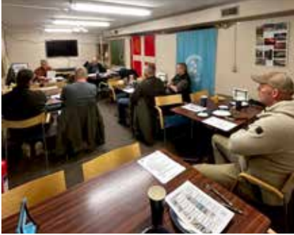
NYT, Vildtkending 1st. Foredrag 2024. Jagtforeningen.