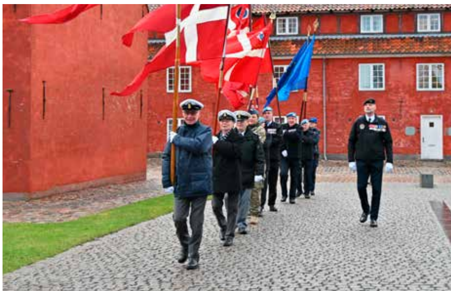
På vej til Paradepladsen.