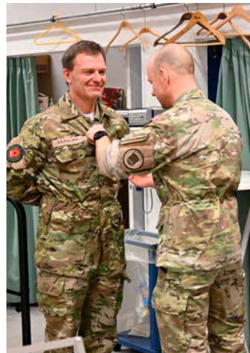
Udnævnelse af ny kompagnichef.