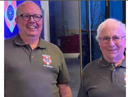
Nye polo-shirts i Kronjylland, Kronjylland.

give veteraner og pårørende en fantastisk oplevelse.