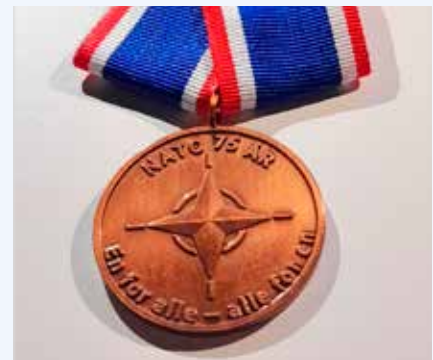
Mindemedalje. Lolland-Falster & Møn

Den 19.-21. april afholdes der en stor totalforsvarsmesse ACTION '24 i Messecenter Fredericia, et flådebesøg i Fredericia Havn samt et Familiearrangement i Fredericia By - alt sammen som er fejring af NATO-jubilæet. Danmarks Veteraner og Veteranstøtten har en fælles informationsstand på messen.