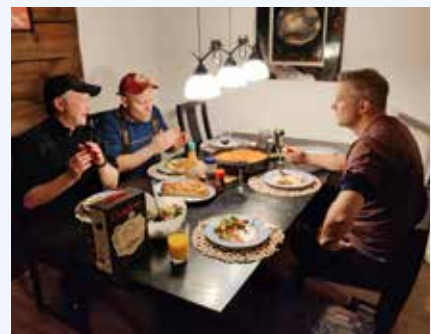
Sverige Hässleholm 1st jagt 2024. Jagtforeningen.