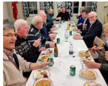
Fra generalforsamlingen. Bornholm.

Igennem Interforce kan Forsvaret så sige tak for støtten. Der vil i løbet af året tilgå forskellige tilbud, som vi kan deltage i som