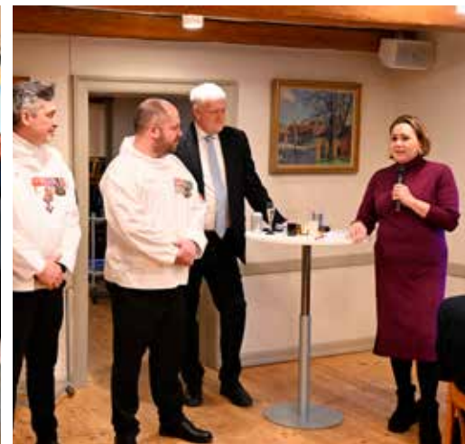
Aaja Chemnitz taler.