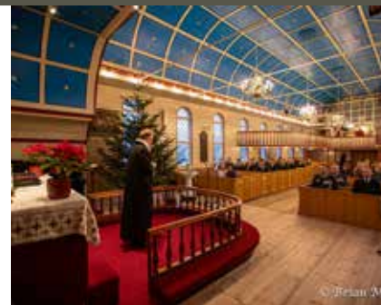
Tórshavn Domkirke, Færøerne.