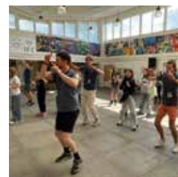
GOD ENERGI, MUSIK, GRIN OG DANS

Læs mere, og tilmeld dig på veteranhjem.dk/camps/sommercamp/