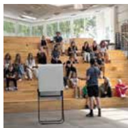
REDSKABER TIL AT UDVIKLE DIG