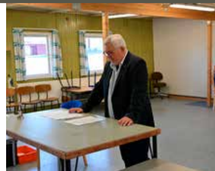
Formanden byder velkommen til generalforsamling, Nordsjælland.