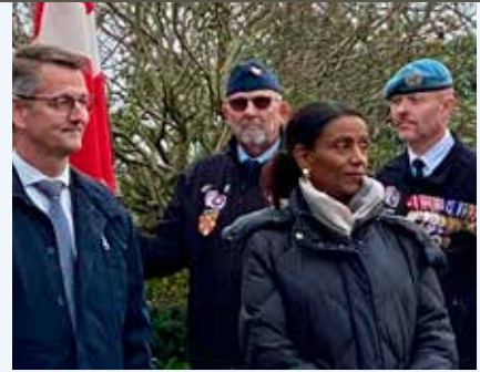
Lemvig Kirkegård. Nordvest.

Den 13. januar drog fem glade veteraner med deres bedre halvdele til årets Nytårskur hos Thy, Mors og Salling. Vi fik en flot modtagelse