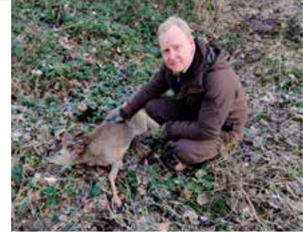
Dyreborg Skov december 2023. Jagtforeningen.

Ring til formanden og hør, hvordan, hvis I er i tvivl. Jagtlods-medlemslisten sluttede 2023 på 32 ud af 35 tilmeldte. Flot resultat. Jagtlod og den positive udvikling, der er sket med nye medlemmer i 2023 har i særdeleshed været med til, at de nye muligheder, der kommer i 2024 af andre jagter på området, kan tilbydes.