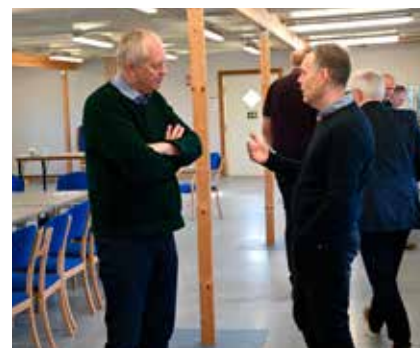
Dirigenten i samtale med revisoren.