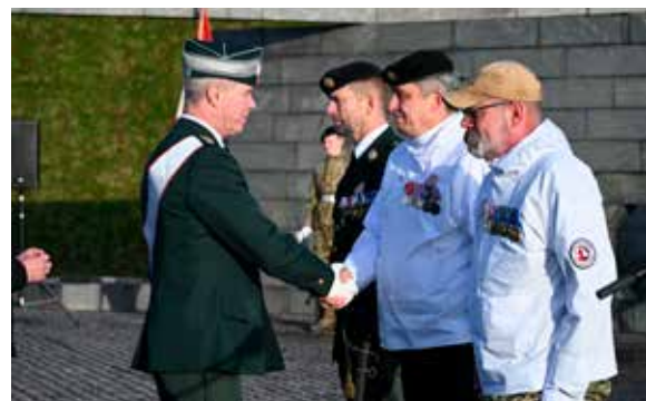
Tillykke med medaljerne.

preciation" til Enid Ingemanns Fond og til Danmarks Veteraner.