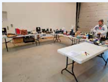
Forberedelse til bankospil den 7. januar. Midtjylland.

25. april: Skydeafslutning sammen med Samvirkets repræsentantskabsmøde.