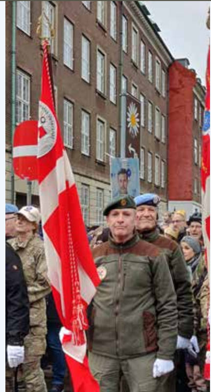
Tronskifte DVJ med Fane. Jagtforeningen.

Jagtforeningen var også tilstede ved Tronskiftet den 14. januar ved Holmens Kirke. Vi var mødt op med fanebærer, formanden samt nogle medlemmer, der stod blandt mængden af en smule overgearede tilskuere - på den absolut gode måde. En fantastisk oplevelse, hvor alt var fredeligt og smukt udført. Tillykke Danmark med vores nye regent, H.M. Kong Frederik X.