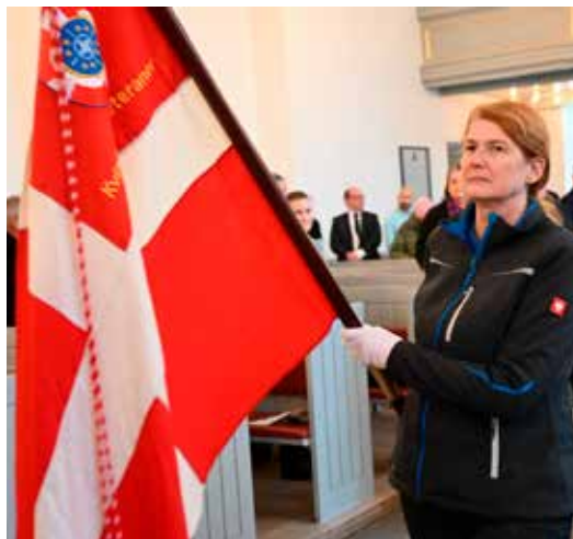
Kvindelige Veteraners fane.