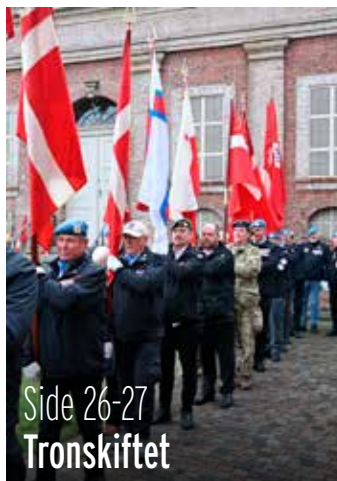
Side 26-27 Tronskiftet