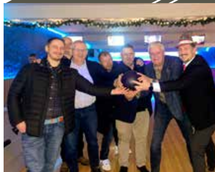
VETS Bowling, Færøerne.

Den 4. december mødtes en trofast skare fordelt fra hele landet til en hyggelig julefrokost på Dannevirke i Odense. Gamle historier blev udvekslet, og nye fortællinger kom også til. Det er blevet en god tradition, at vi mødes centralt i det lille land. Og centralt er Odense.