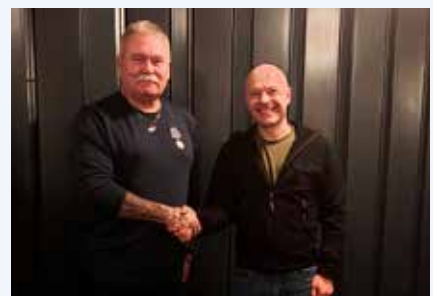
Næstformanden uddeler 40-års medalje til formanden. Nordvest.